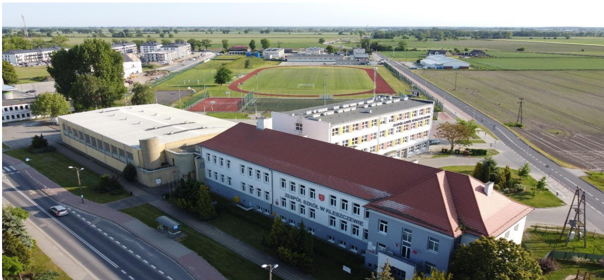
Zespół Szkół w Kleszczewie