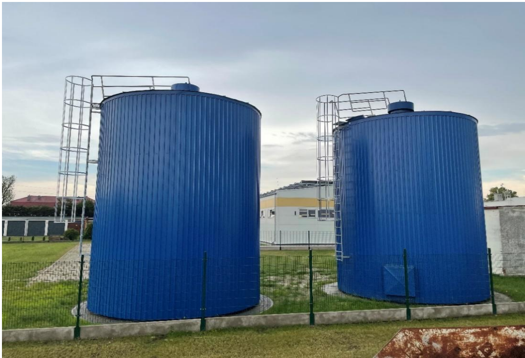
SUW w Kleszczewie zbiorniki retencyjne, każdy o pojemności użytkowej 100 m 3

Zadanie dostawy wody do odbiorców w całości realizowano przez Zakład