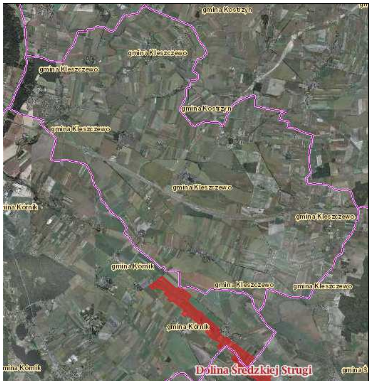
Rysunek 3. Położenie obszaru sieci Natura 2000 Dolina Średzkiej Strugi .