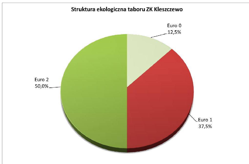
Rysunek 2. Struktura ekologiczna taboru ZK Kleszczewo 9