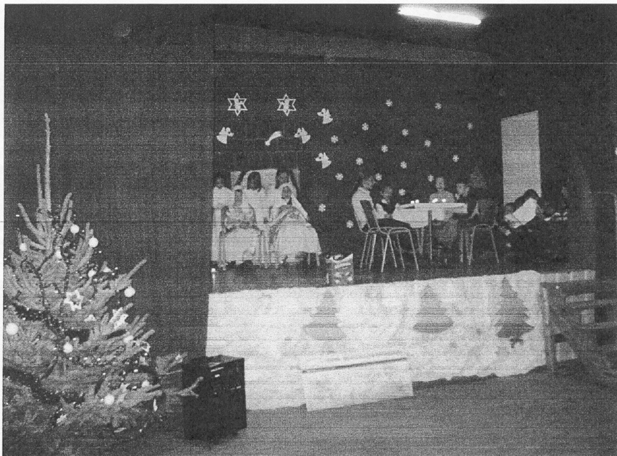
Przedstawienie w świetlicy w Kleszczewie w dniu 17 grudnia 2007r.

W okresie letnim w miesiącu lipcu i sierpniu zostały uruchomione dodatkowe świetlice środowiskowe w Komornikach, Nagradowicach i Gowarzewie i w tym okresie działaniem świetlic objęto 108 dzieci. W okresie wakacji dzieci ze świetlic wykonały prace plastyczne na temat „Stop nałogom”. Były różne zabawy a w przerwie drugie śniadanie lub podwieczorek. Celem ich to między innymi uczenie prozdrowotnych zachowań bez alkoholu, papierosów i narkotyków. Dzieci ze świetlic 10 prac plastycznych pokazały na wystawie „Talent i Sprawność 2007” na Polagrze w Poznaniu w dniach od 28 września do 30 września 2007r. Przez odwiedzających został zakupiony „Pomponowy stwór” i jedna papierowa róża. Jest to rodzaj promocji gminy i dowartościowania uczestników świetlicy i zachęcenia do próbowania swych sił w rękodziele.