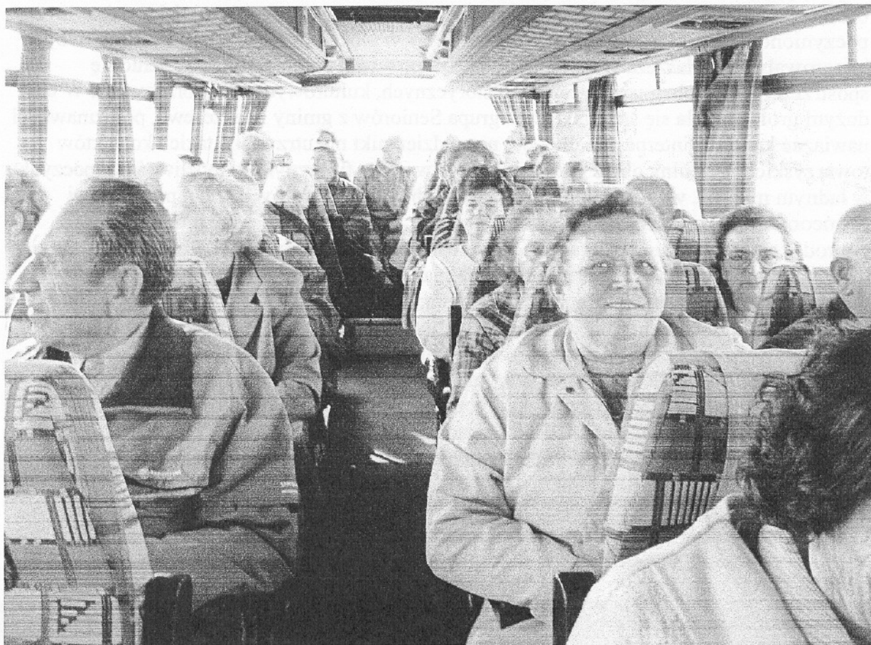
Seniorzy w jednym z autokarów w dniu wjazdu do Dziekanowic- Lednicz

Program „Za Pan Brat z Kulturą” wyniósł kwotę 4662zł, z tym, że ze środków budżetu Wojewody wydatkowano 3997 zł, pozostałe finanse to jest 665 zł pochodziło ze środków gminy, a więc 85,7 % wydatków są zewnętrzne. Dzieci ze świetlic środowiskowych z Tulec i z Kleszczewa aktywnie uczestniczyli w okresie od sierpnia do grudnia 2007 roku w działaniach z zakresu kultury i promowania jej, a przede wszystkim w wyjazdach do kina Cinema City Kinopolis w Poznaniu na filmy z rodzaju kina rodzinnego i filmów przeznaczonych dla dzieci i młodzieży. Było 6 wyjazdów do kina na filmy: „Shrek 3”, „Na fali”, „Ratuj”, „Film o pszczołach”, „Pana Magorium cudowne emporium”, „Złoty kompas”. Przez program rozwinęto atrakcyjniejsze formy spędzania czasu wolnego i umożliwiono bycie w kinie 71 wychowankom świetlic, w którym nie byłoby tak często, tym bardziej, że z ankiet wynika, że rodzice nie kształcą kulturowo w zakresie wspólnych wyjazdów do kina. Zdecydowanej większości program podobał się i oczekują dalszych wyjazdów do kina. Rezultatami tego programu było: