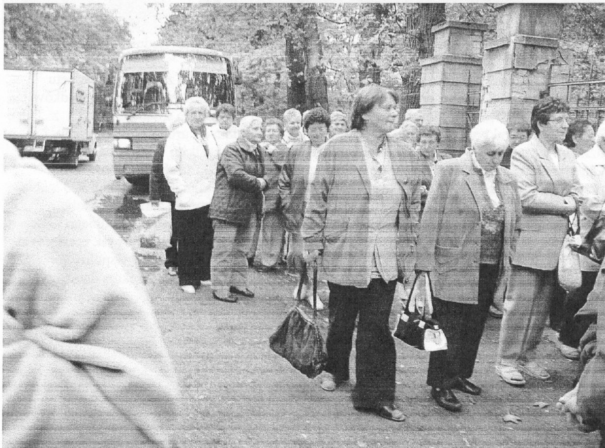
Seniorzy przed wejściem do parku w Rogalinie

Dokonano wynajmu autokaru z firmą transportową w Środzie Wlkp. , która sprawnie i bezpiecznie zawiozła Seniorów do miejsc, które zwiedzali, następnie rozwiozła do miejsca zamieszkania.