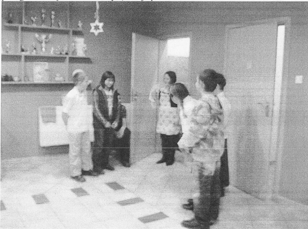
Dzieci tuleckie w przedstawieniu w dniu 18 grudnia 2007 roku

Program „Uśmiech Mikołaja 2007 w świetlicach środowiskowych gminy Kleszczewo” był przeznaczony dla dzieci ze świetlic środowiskowych w Tulcach i w Kleszczewie i dał radość 51 wychowankom placówek opiekuńczo-wychowawczych wsparcia dziennego, którzy otrzymali paczki świąteczne na Boże Narodzenie w kwocie 25 zł każda / 3 czekolady Goplany, 1 opakowanie Toffifee, 1 czekolada Kinder, 2 paczki pierników Wedla, 1 wafelek Princessa, 1 wafelek Grzesiek/. Całość programu to kwota 1275 zł, z tego 1000zł to dotacja z Fundacji Banku Zachodniego WBK S.A. Banku Dziecięcych Uśmiechów, 275 zł to środki finansowe gminne, a więc 78,4 % tych finansów pochodzi z zewnątrz. Paczki ze słodyczami były wręczone na spotkaniu opłatkowym w dniu 17 i 18 grudnia 2007r., na których dzieci pokazały przedstawienia teatralne związane tematycznie ze świętami i wigilią. To wsparcie to obdarowanie Uśmiechem Mikołaja w postaci paczek ze słodyczami, co ma na celu poprawę systemu wartości u zainteresowanych. Wsparcie to ma wpływać na zdrowie społeczne młodego człowieka ze świetlic środowiskowych, ponieważ poprzez obdarowywanie na święta uczy się miłości bliźniego i wzorców na przyszłość, że dobroć jest ważna, pomaga żyć, daje radość. Sądzi się, że w przyszłości te dzieci dziś otrzymujące upominki będą pomagać w miarę możliwości innym, mniejszym od siebie.