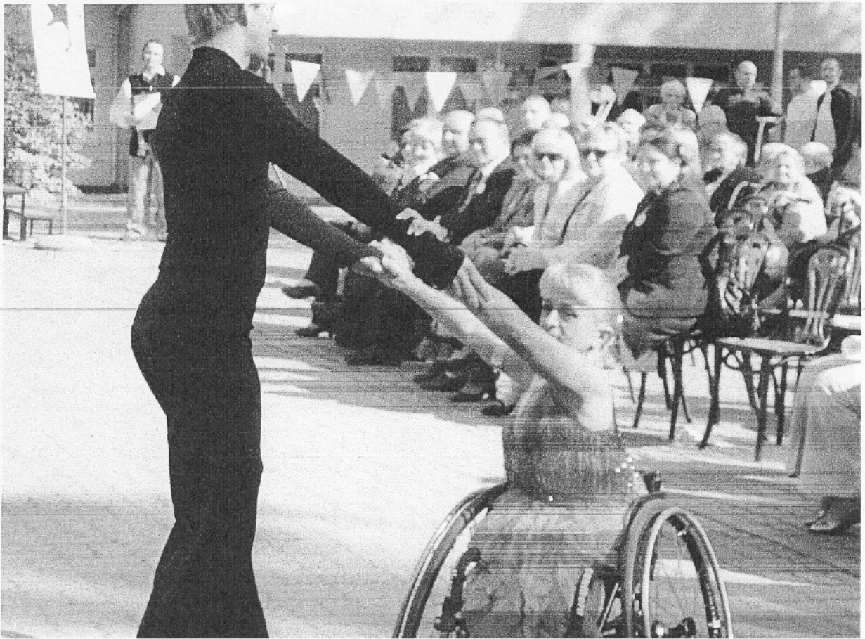
Występ artystyczny w Lisówkach, który bawił także naszą grupę osób z gminy Kleszczewo

Ośrodek Pomocy Społecznej w miesiącu października zorganizował wyjazd 53 osobowej grupy z gminy Kleszczewo do Lichenia do Sanktuarium Marvinego, a wieczorem uczestników autokarem wynajętym w Środzie zawieziono do ich miejsc zamieszkania.