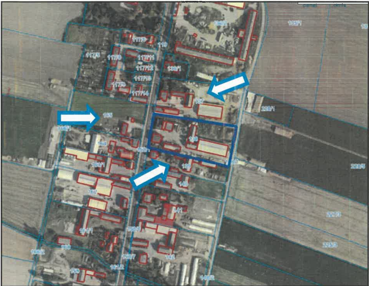
Rys. 1. Lokalizacja terenów objętych ochroną akustyczną

dopuszczalnych poziomów hałasu w środowisku (Dz. U. z 2014 r., poz. 112) tereny zakwalifikowano jako „Tereny zabudowy zagrodowej”, dopuszczalny poziom hałasu: L_{AeqD} = 55 , L_{AeqN} = 45 .